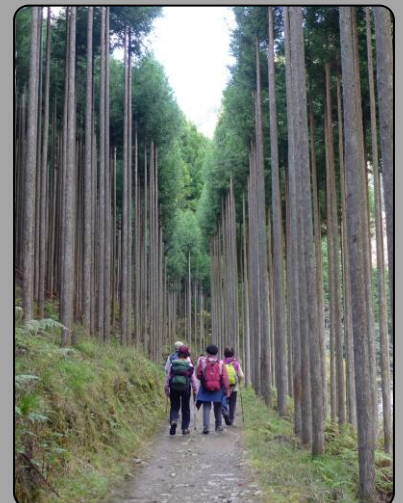
手入れの行きとどいた北山杉の木立