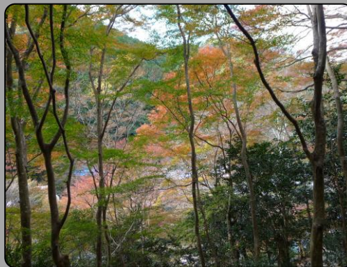
清滝川に沿って歩く