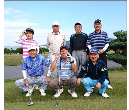
いわふねクラブからの参加者

いよいよコンペ当日、天候にも恵まれた最高のゴルフ日和でもあり、同伴競技者と共に和気あいあいと楽しい一日でもありました。競技終了後、成績発表を迎えるのですが、今回のルールはダブルペリア方式であり、だれが入賞しても不思議ではありません。参加者の中には、私よりもお上手な方もおられ、とても入賞できると思っておりましたが、成績結果表を受け取った時は大変驚きました。