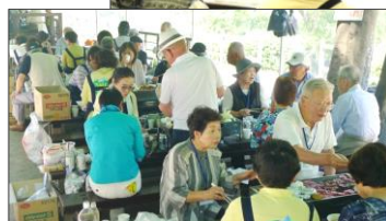
昨年の総会とバーベキューの様子