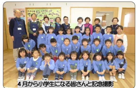
4月から小学生になる皆さんと記念撮影

私たちが退室した後に泣きだした子がいて、先生が玄関先まで連れて来られるなど、今年も心に残る活動が終わりました。