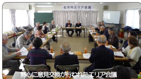
熱心に意見交換が行われたエリア会議

2月27日「いわふねクラブ」が幹事拠点となり、交野ボランティアセンターで「第2回北河内エリア会議」が開催されました。