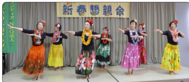
↑ NBO10の皆さんによるフラダンスの熱演