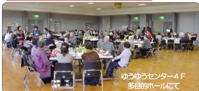
ゆうゆうセンター4F 多目的ホールにて