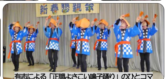
有志による「正調よさこい鳴子踊り」のひとコマ