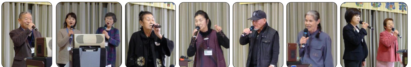
カラオケで自慢の歌を熱唱され、会場を盛り上げました