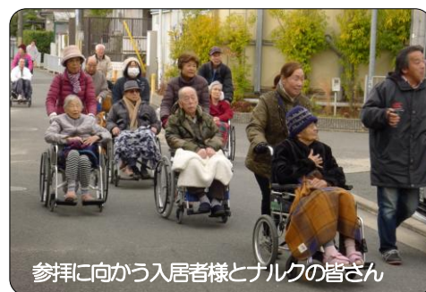
参拝に向かう入居者様とナルクの皆さん

あろう後期高齢者。誰にでも愛される人を目指してと祈るばかりです。初参加でしたか得る物が盛り沢山でした。