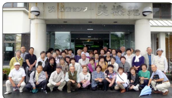
バスツアーに参加された皆さん (美榛苑前で)

家」と記された標識や建築寛政3年と書かれた家もあった。帰りの車中で温泉組の方から「良いお湯で疲れがとれたよ」とお聞きし、どちらも良かったですねと笑い合った。シルバー川柳の披露があった中で今私が実感しているのとピッタリなのを一句。～ 思い出が 身辺整理の 邪魔をする ～