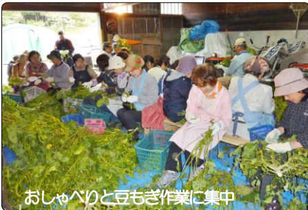
おしゃべりと豆もぎ作業に集中