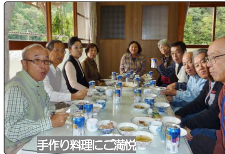
手作り料理にご満悦