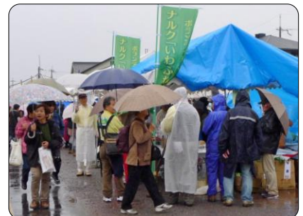
昨年は生憎の雨模様でしたが、大勢の方がお越しになりました