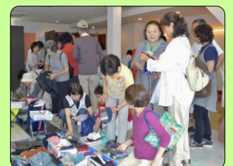
バザー会場の様子