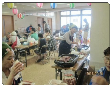
フランクフルトを焼いています