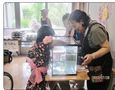
ゲームに夢中です