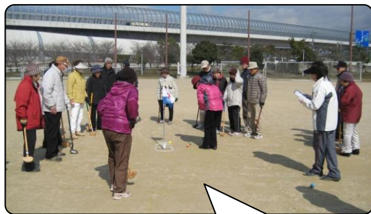
みんなの注目の的 緊張するわ!