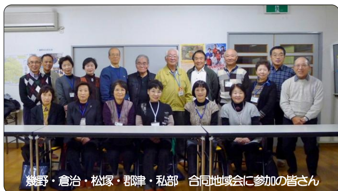
幾野・倉治・松塚・郡津・私部 合同地域会に参加の皆さん

役員さんより活動状況は順調に伸びていることや子育て支援の内容など、いろいろ努力されていることもお聞きし、知らないことばかりでびっくりしました。質疑応答でも色々な意見が出て、「参加して楽しみましょう」「参加してみんなで盛り上げよう」など話が弾み、楽しくおしゃべりしながら終わることができました。