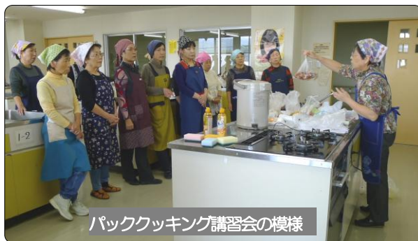
パッキング講習会の模様

※11月14日のTBSテレビの「はなまるマーケット」でもポリ袋調理法が放映されました。