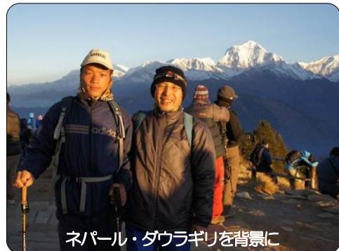
ネパール・ダウラギリを背景に

これからもハードなコースであっても参加できるよう健康に気を付けて山歩きを楽しみたいと思います。