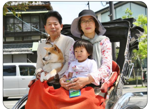
北野さんご一家と愛犬ミルキィー

活動名としては“犬の散歩”ということですが、間接的に働くお母さんの子育て支援をしていただいているとも思っています。感謝の気持ちで一杯です。今後ともどうぞ宜しくお願いいたします。