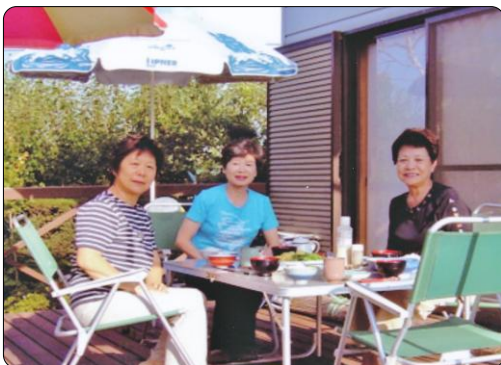
テラスで朝食を！さわやかで気持ちいい！

一年のうち三分の一くらいは田舎の長閑な「ばあ様」暮らしをしています。唐松が紅葉する頃、隣の畑の「ぶじりんご」が赤く熟します。「蜜入りのんご」を丸かじりして、信州に来ませんか？ 夏の夕べは「涼風」が吹き、宅急便で大阪に送りたい気分です。 信州の田舎暮らし 原 智佳子 早朝カッコウの鳴き声で自覚め、天竜川を真ん中に、東に南アルプス、西に中央アルプスの伊那谷、標高七〇〇米の所に「うさぎ小屋」があります。 新鮮な野菜と果物を頂く時、自然の恵みに感謝し、私の細やかな贅沢と感謝しております。