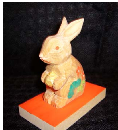
今年の干支 うさぎ