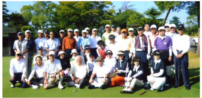
高畑会長夫妻を囲んで

ゴルフ終了後、有志で、クラブをマイクに持ち替えて、カラオケで大ハッスル。何とも、元気なおじさん達です。ナルクのパワーを実感させられました。